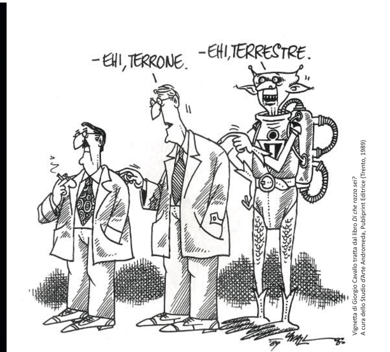
Vignetta di Giorgio Cavallo tratta dal libro Di che razza sei? A cura dello Studio d'Arte Andromeda, Publiprint Editrice (Trento, 1989)