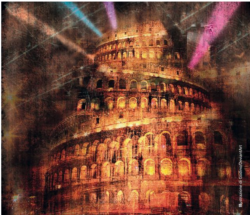
Illustrazione di Gocimo/DeviantArt